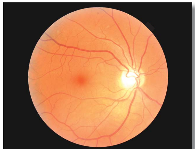
▲ Foto digitale della retina

Centinaia di partecipanti allo studio Health 2020 hanno tratto beneficio dagli esami della vista previsti nell'ambito del programma.