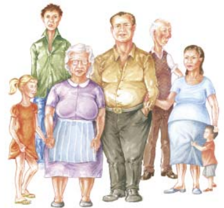
Illustrazione di Con Stamatis

Agli uomini partecipanti allo studio Health 2020 fra breve verranno fatte delle domande interessanti che potrebbero fornire nuove prove sul cancro prostatico.