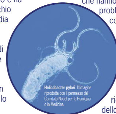
Helicobacter pylori.

"Bisogna notare che l' H. pylori è un'infezione comune e non tutti quelli che hanno l'infezione sviluppano il cancro dello stomaco, però se avete dei sintomi che vi preoccupano consultate il vostro medico di famiglia.